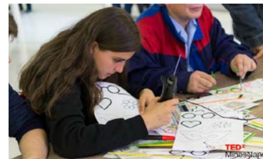
3D Doodler, Labs 2016