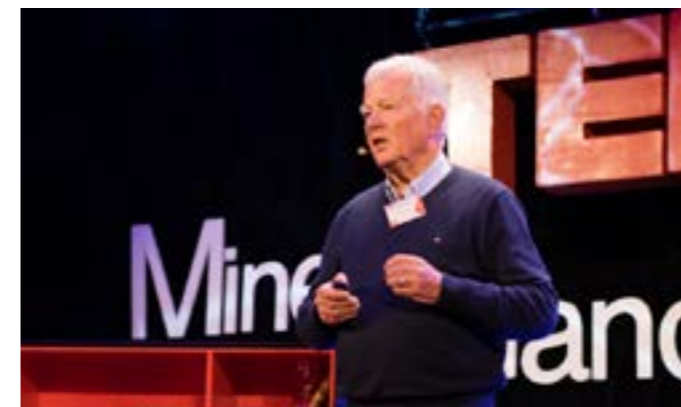
Jean-Loup Chrétien, Speaker 2017