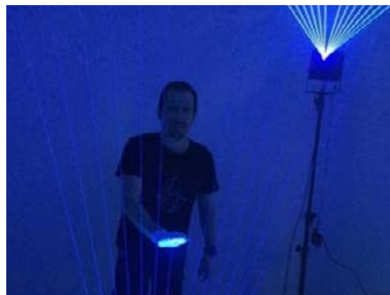
Harpe Laser, Labs 2018