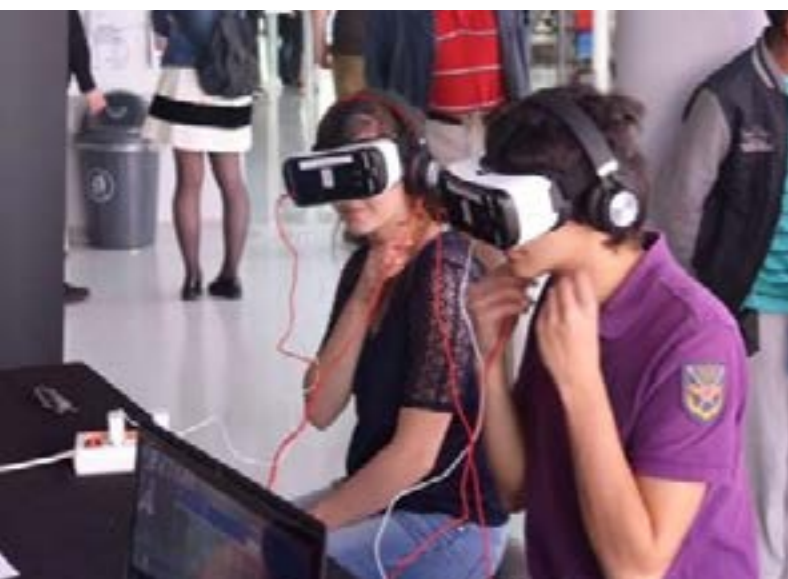
Réalité virtuelle, Labs 2018