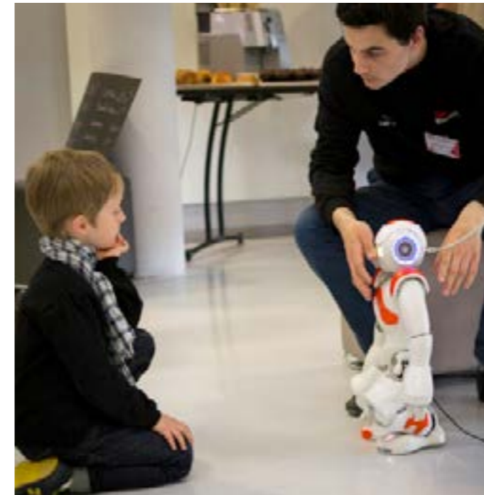
Robot NAO, Labs 2018