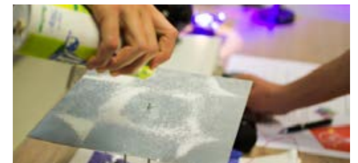
Figures de Chladni, Labs 2019