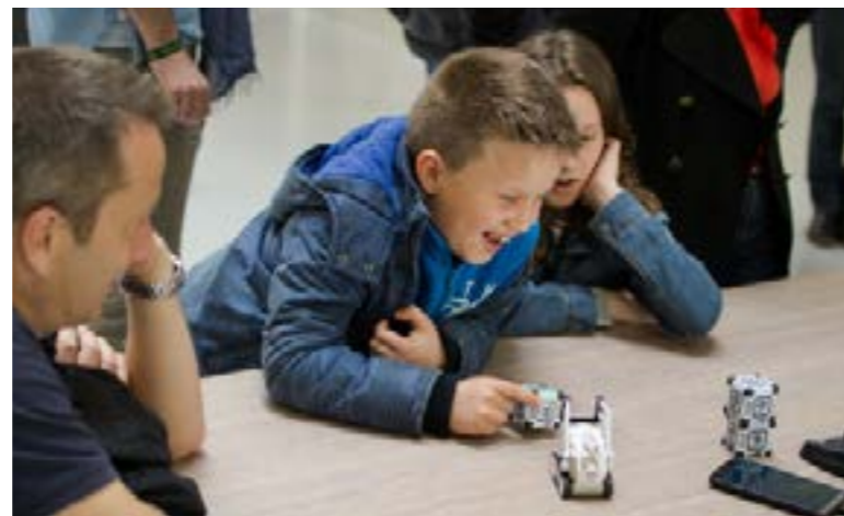
Robot Cozmo intelligent ANKI, Labs 2017