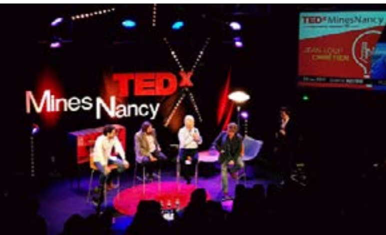
Speakers de l'édition 2017

Au vu des mesures gouvernementales, Pour sa 8ème édition, l'événement prendra une forme hybride et sera partiellement présenté à distance. Le 29 mai , les conférences auront lieu en présentiel au campus ARTEM. Pour répondre aux contraintes sanitaires, l'évènement en présentiel ne sera pas ouvert au public. Néanmoins, les TEDxMinesNancy Talks seront rediffusés sur Youtube et sur notre site internet le 24 juin .