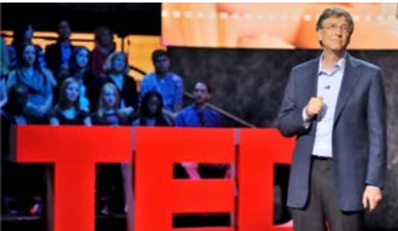
Conférence TED de Bill Gates en 2013

TED (Technology, Environment, Design) est une fondation américaine ayant pour slogan « Ideas Worth Spreading » (des idées qui méritent d'être partagées). Les événements TED sont des cycles de conférences pluridisciplinaires reconnus dans le monde entier. L'objectif de TED est de promouvoir des idées émergentes et de les diffuser au grand public via des vidéos sur Internet qui sont accessibles gratuitement par des millions de personnes dans le monde.