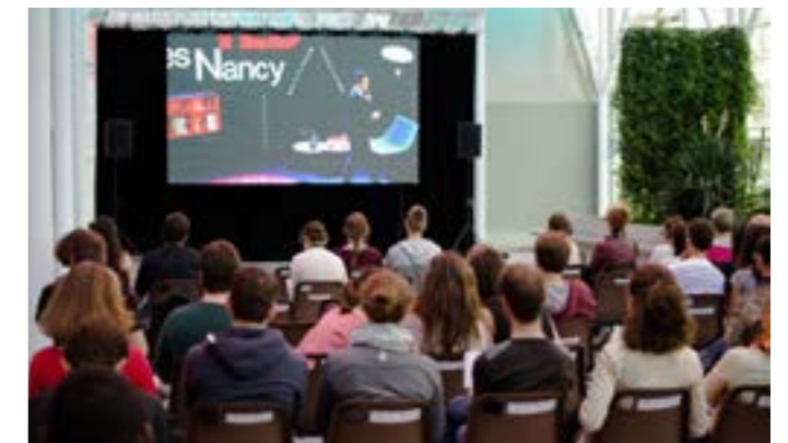
Retransmission live dans la verrière, 2018