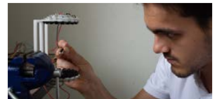
Lévitacion acoustique, Labs 2019